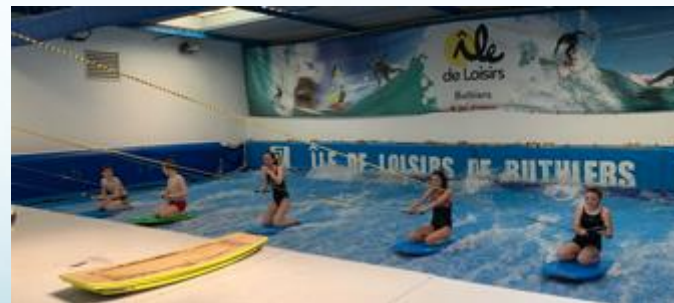
Simulateur de glisse