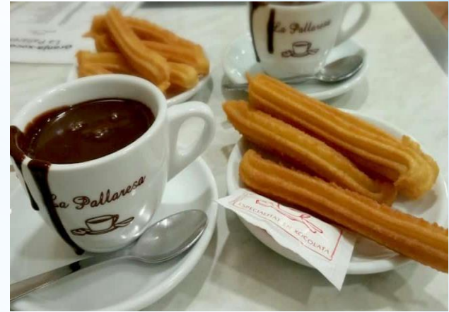
Churros y chocolate